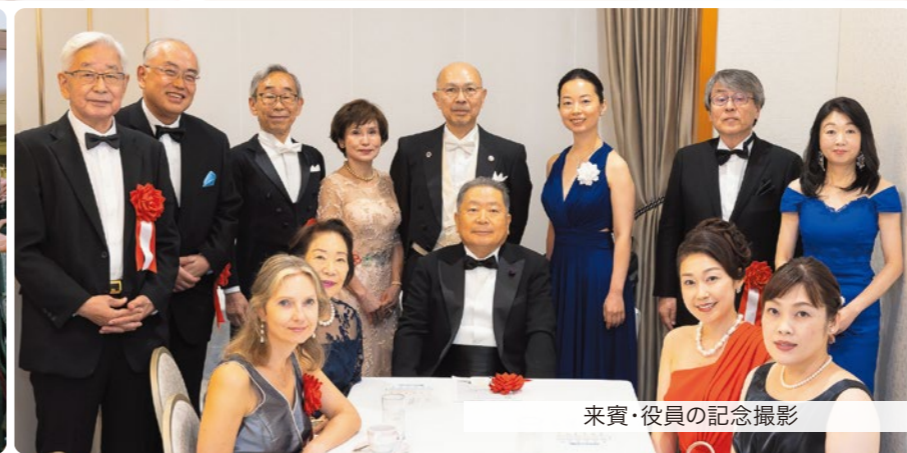
来賓・役員の写真撮影