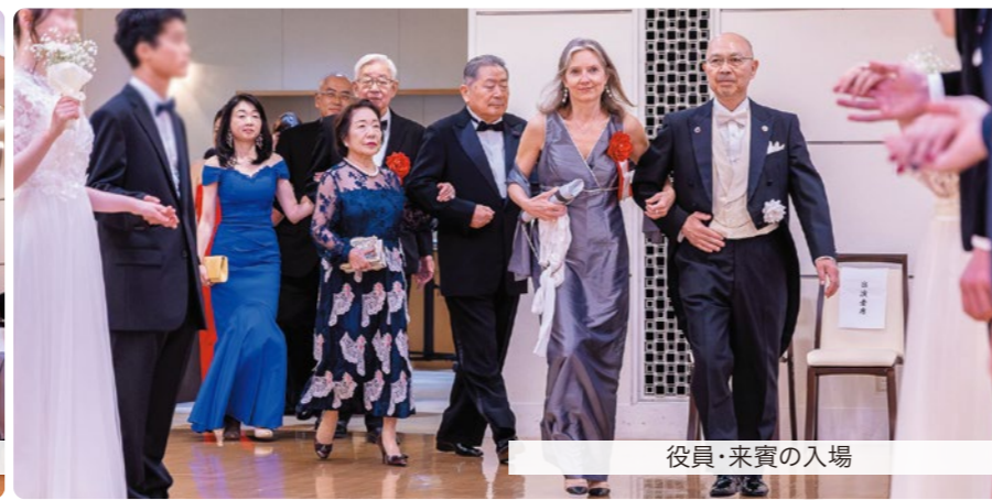
役員・来賓の入場